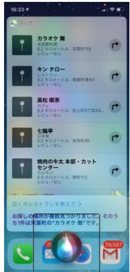
図 Siri にレストランの検索を依頼した結果の画面