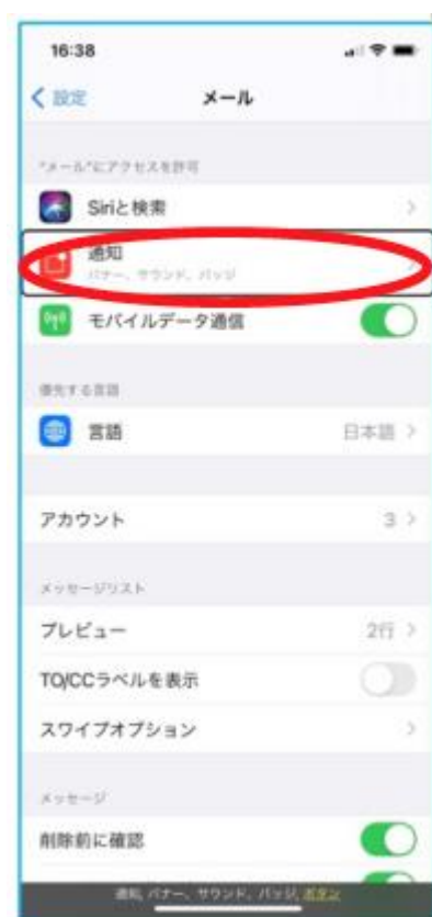
図 設定アプリでメールの設定