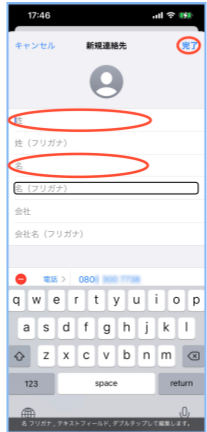
図 姓と名を入力して、連絡先に登録