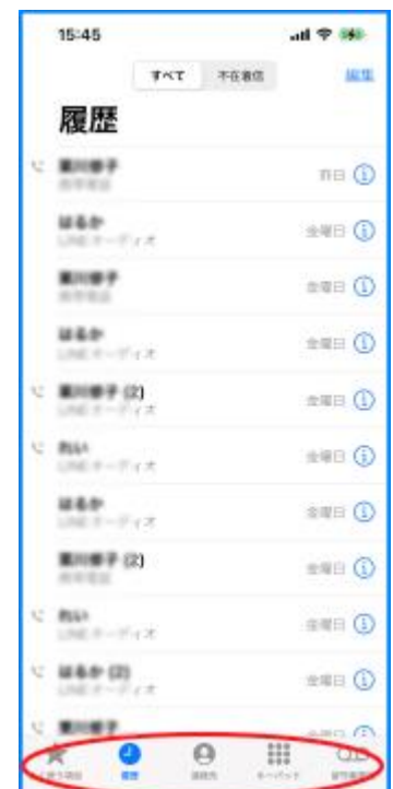
図 電話アプリの履歴画面