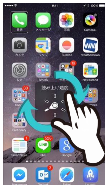
図 ローターのジェスチャー