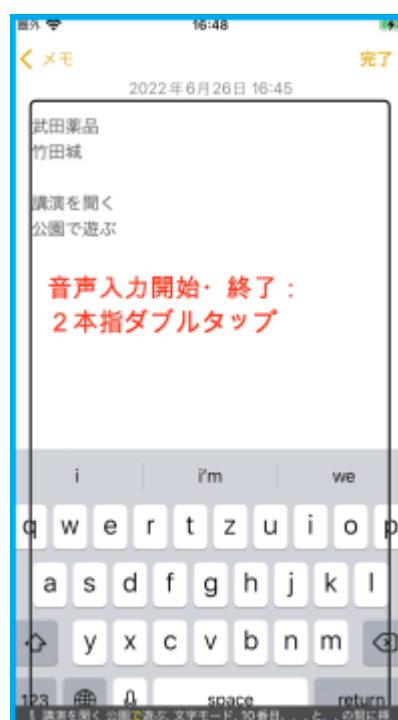
図 メモに音声で入力