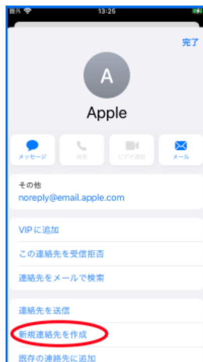
図 差出人の詳細画面