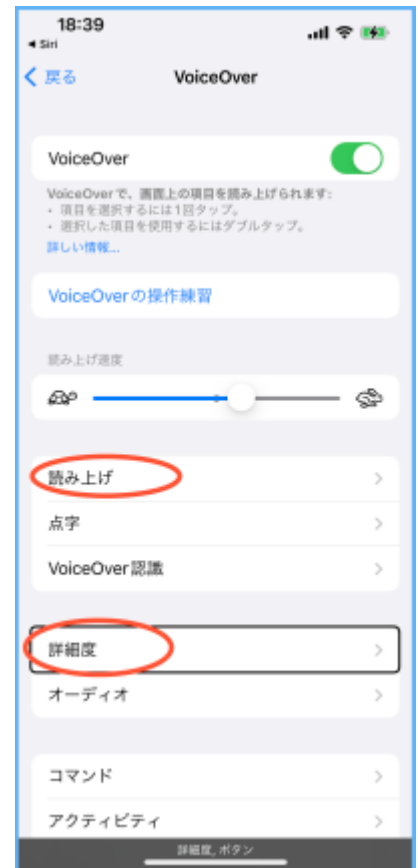
図 VoiceOver の設定画面