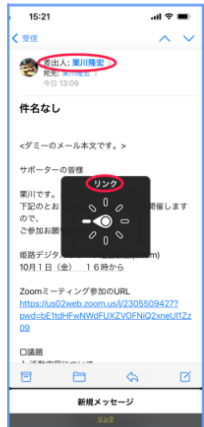
図 メッセージ画面のリンクを探す