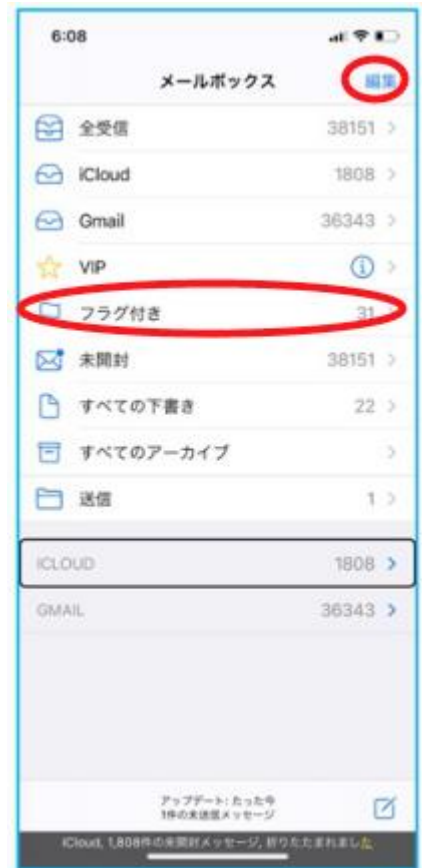
図 メールボックスの画面