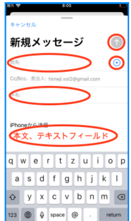
図 新規メッセージ画面