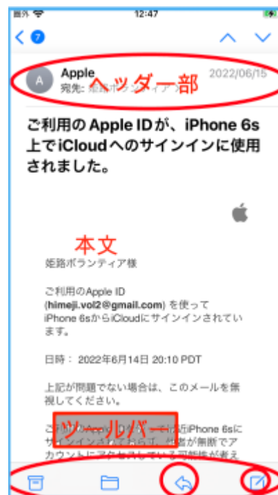
図 メッセージ画面