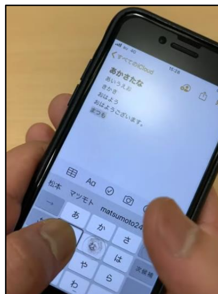
図 文字入力時の指の使い方