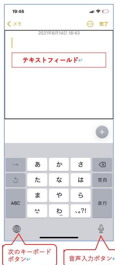
図 メモと日本語かなキーボード