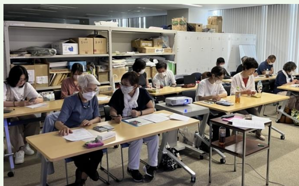
写真 スマホサポーター研修会の様子

私たちのミッションは、そのようなサポートゼロ地域を解消することです。そのためには、多くのサポーターが必要になるので、県下でサポーター1,000人育成計画を実施中です。