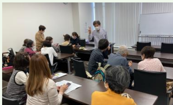
写真 スマホ教室の様子

障害物や道順を知らせてくれる歩行支援アプリ、活字文書を読み上げる視覚支援アプリ、ラジオ番組を聞くアプリなどに人気があり、多様なニーズに対してサポート活動をしています。