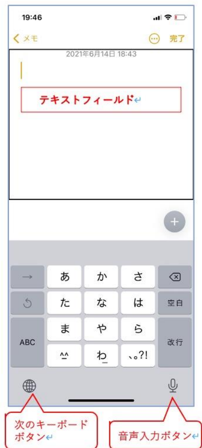
図 メモと日本語かなキーボード