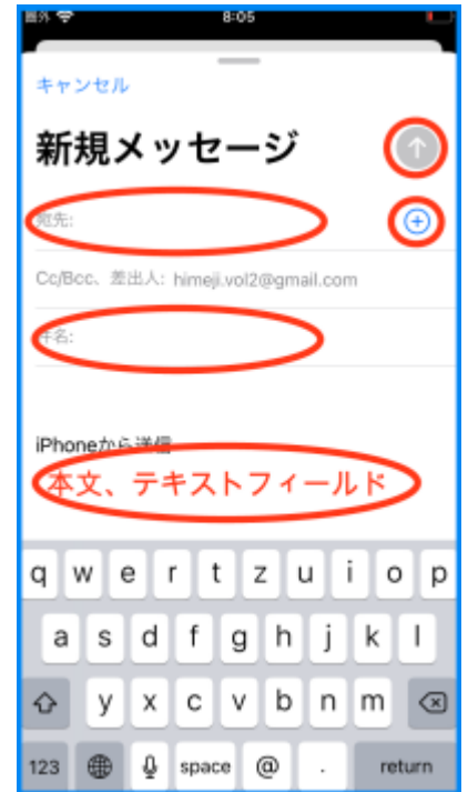
図 新規メッセージ画面