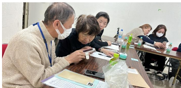
スマホ入門講座でのサポートの様子（尼崎）