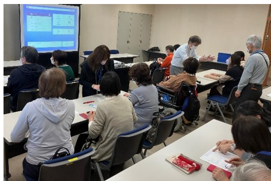
スマホ教室の様子（明石）

視覚障がい者にとって、スマホは必須の生活ツールと言われますが、スマホを活用している人は2割に満たないのが実情です。「近くにスマホの使い方を教えてくれる人や団体がない」ことが、スマホが普及しない大きな原因です。兵庫県下の多くの地域で、サポート団体がなく、サポートできる人がいません。