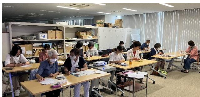
サポーター研修会の様子（姫路）

私たちは、視覚障がい者を対象にスマホ（iPhone）の使い方をサポートするボランティア団体です。毎月定期的の中・上級者向けのスマホ教室や交流会などを開催しています。スマホ教室では、マンツーマンで受講者にアドバイスを行うサポーターが重要な役割を担っています。